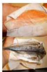
③軽くキッチンペーパー等で水気を落として料理します。