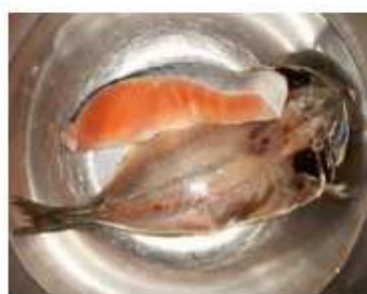
②お水にそのまま15分浸けます。