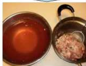
③お肉を引き上げると...