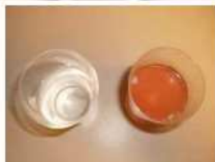
④水と比較すると一目瞭然